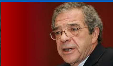
2007 - TELCO 22,4% (Telefonica, Mediobanca, Generali, Banca Intesa)