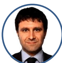
Sergio Boccadutri Commissione Parlamentare per l'Indirizzo Generale e la Vigilanza dei Servizio Radiotelevisivi