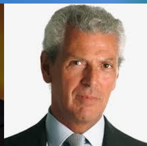
2001 - OLIMPIA 19% (Pirelli, Benetton, Banca Intesa, Unicredit, (Hopa di Gnutti)