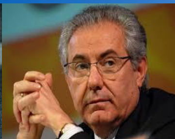
1999 - OPA OLIVETTI TECNOST DEL 51%, ROBERTO COLANINNO