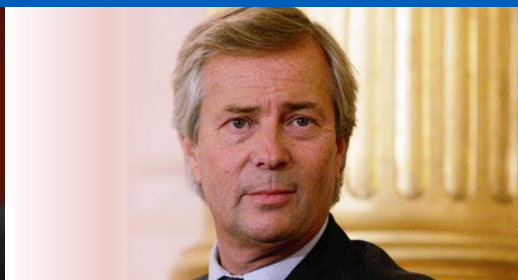
2015 - Giugno 2015 Vivendi 8% 2015 - Settembre 2015 Vivendi 19.9%