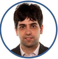
Paolo Romano Componente organi parlamentari: IX Commissione (Trasporti, Poste e Telecomunicazioni)