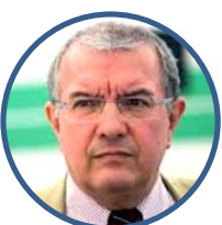
Massimo Mucchetti Presidente della X Commissione permanente (Industria, Commercio e Turismo)