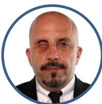
Marco Miccoli Componente organi parlamentari: XI Commissione (Lavoro Pubblico e Privato)